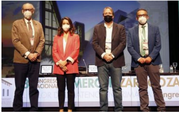
Semergen analiza la "crítica situación" de la Medicina rural en España